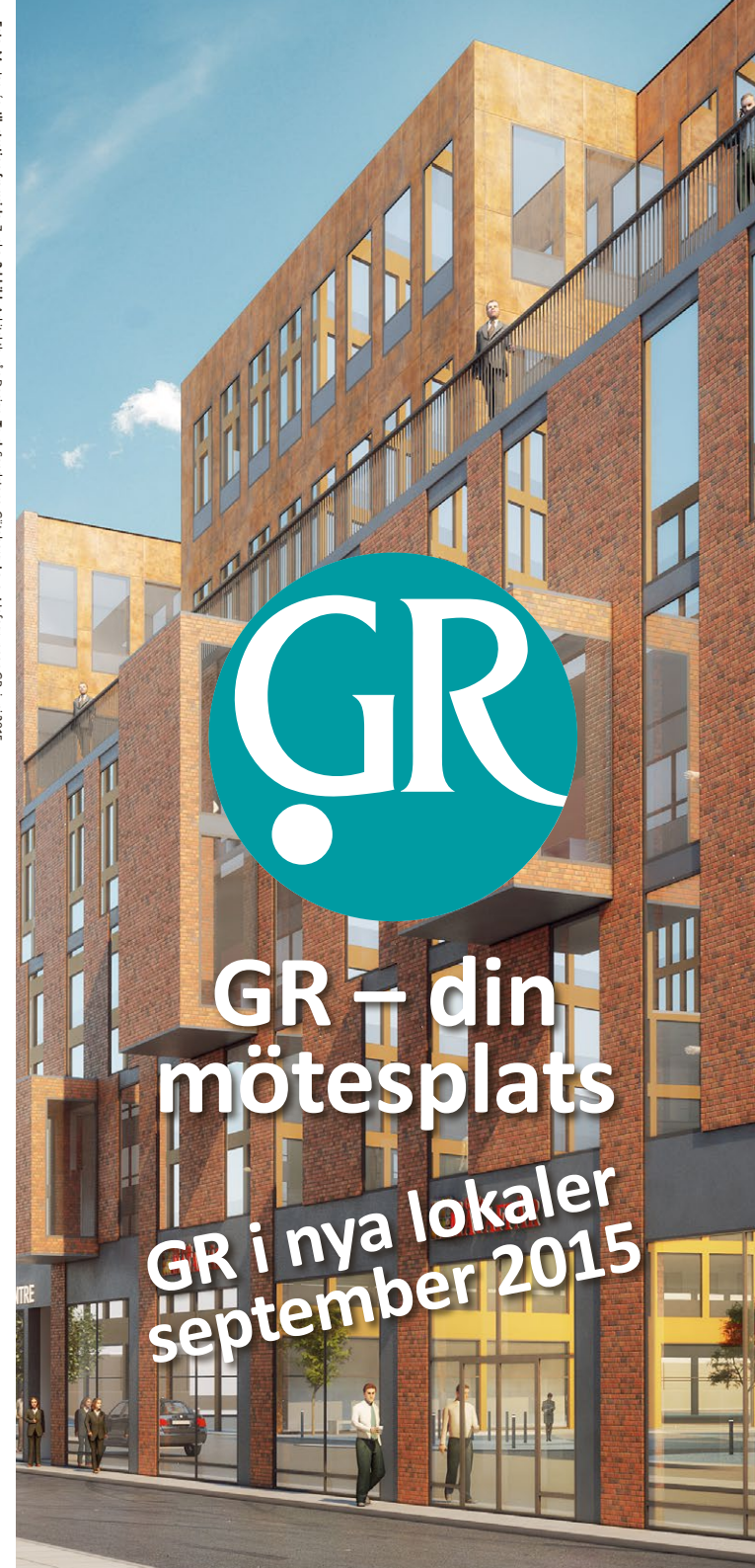
Illustration: Transmedia Zinkla. 3d-bild: Arkitektbyrå Design. Tryck: Sandstens, Göteborg. Layout: Infiggruppen GR, Juni 2015.

Besök Anders Perssonsgatan 8 | Post Box 5073, 402 22 Göteborg Tel 031-335 5000 | Fax 031-335 51 17 e-post gr@grkom.se | www.grkom.se