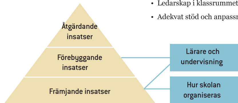
Modell över olika typer av insatser för att möta elevers behov

Här lyfts vikten av organisatorisk medvetenhet, det innebär att skolan har ett helhetsperspektiv